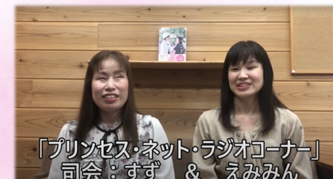
「プリンセス・ネット・ラジオコーナー」 司会：すず & えみみん

プリンセスネットラジオは、「ブラインドメイク物語」を執筆した視覚障害者が中心となり、企画、構成、編集すべてを当事者で行っているインターネット番組です。協会ホームページからご視聴いただけます。過去の放送もご視聴いただけますので是非お楽しみください！